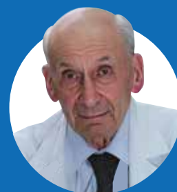
К 95-ЛЕТИЮ АКАДЕМИКА А.Б. СМУЛЕВИЧА